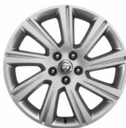
18" 9-SPOKE 'STYLE 9008' SILVER C56G Banden: 235/60 R18