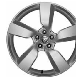
19" 5-SPOKE 'STYLE 5049' SILVER C56K Banden: 235/55 R19