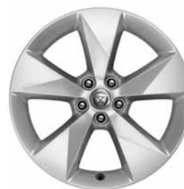
18" 5-SPOKE 'STYLE 5048' SILVER C56H Banden: 235/60 R18