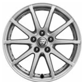
17" 10-SPOKE 'STYLE 1005' SILVER C56W Banden: 225/65 R17