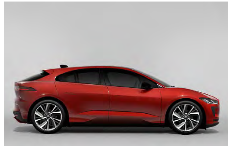
22" 5-SPLIT SPOKE 'STYLE 5056' DIAMOND TURNED FINISH & CONTRAST GLOSS DARK GREY