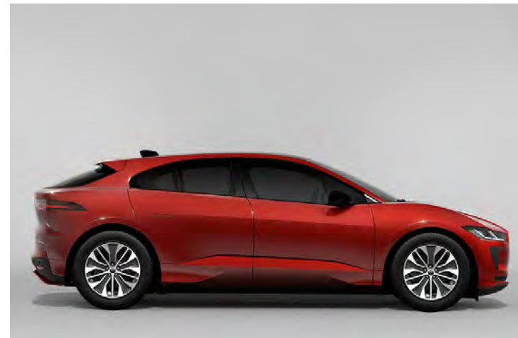
19" 5-SPLIT SPOKE 'STYLE 5055' DIAMOND TURNED FINISH & CONTRAST GLOSS DARK GREY